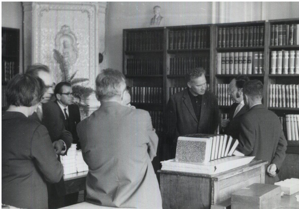
Lietuvių kalbos ir literatūros institute.